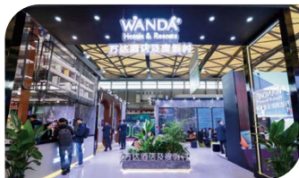
万达酒店及度假村