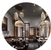
餐饮配套设施及设计